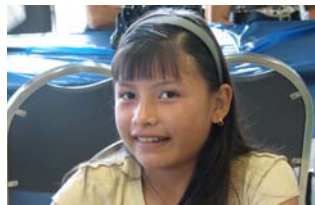
Niña celebrando victoria de PACE

Padres de Fullerton ganan mas de $120,000 para la programa PACE una programa preescolar y alfabetización para padres de familias de bajos recursos.