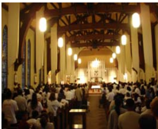
La comunidad se junta para apoyar una reforma migratoria justa

Iglesia Metodista Unida de Garden Grove Iglesia Primer Presbiteriana